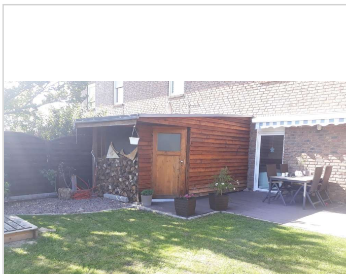
Terrasse und Gartenhaus